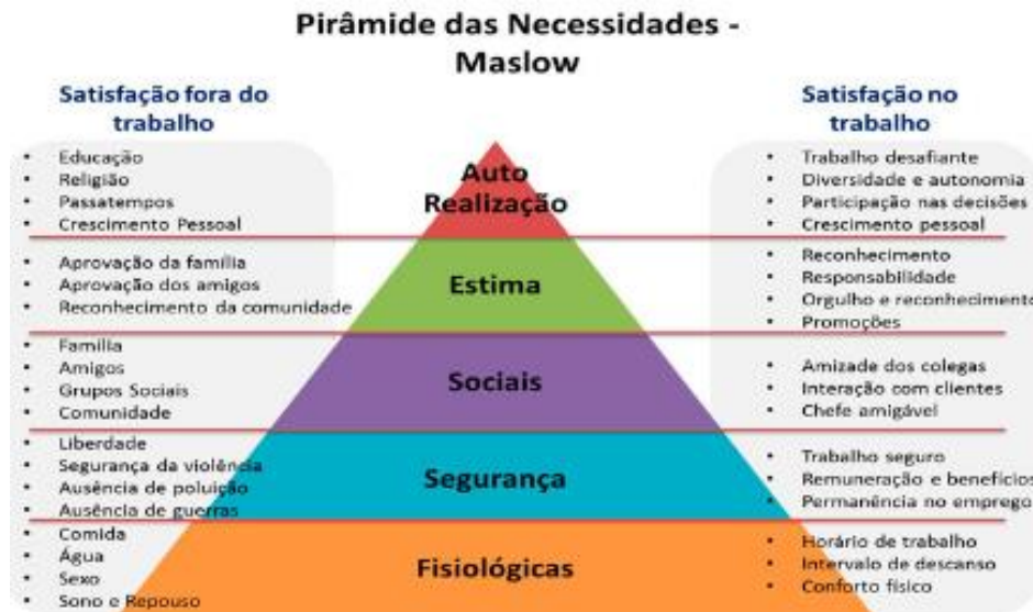
FIGURA 01: Hierarquia de necessidades de Maslow