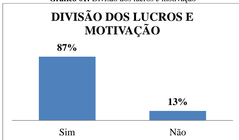
Gráfico 01: Divisão dos lucros e motivação

A Agro Baggio, no fim do exercício social, disponibiliza um valor de seus lucros para ratear entre seus colaboradores, o que se constitui relevante fator de motivação.