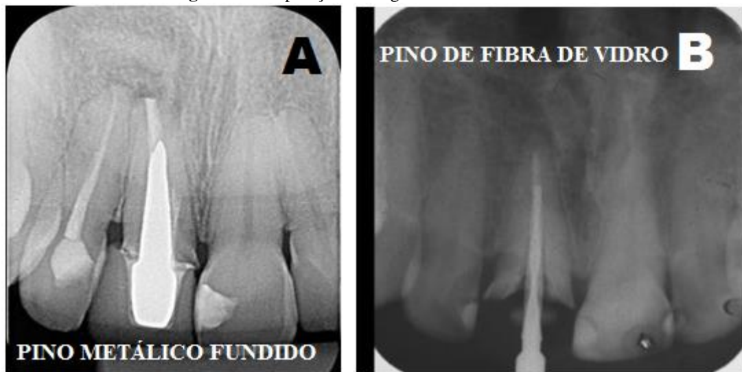
Figura 2: Comparação Radiográfica entre NMF e PFV

A Figura 2 traz uma comparação radiográfica entre o Pino Metálico Fundido e o Pino de Fibra de Vidro.