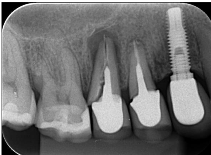
Figura 3. Fratura de raiz com Núcleo Metálico Fundido

O tipo de pino e suas rigidez parecem ser um fator determinante da falha catastrófica, é a fratura da raiz que faz com que tenha uma perda dental. Embora em ensaios clínicos revisados em números absolutos, foram observadas fraturas radiculares Pinos de metal e fibra de vidro. (SCHMITTER; HAMADI; RAMMELSBERG, 2012).