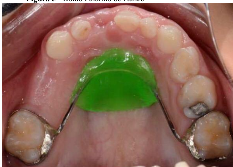
Figura 5 - Botão Palatino de Nance

Possui como indicação quando verifica-se que há perdas bilaterais e múltiplas de molares decíduos superiores, tendo presente o primeiro molar permanente, que disponha a ser conservado na região onde se irrompeu, impedindo que haja o deslocamento mesial de molares permanentes, conservando o espaço dos caninos, pré-molares e também para reposicionamento de incisivos que estejam apinhados. 25