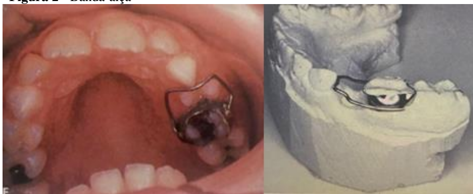
Figura 2 - Banda-alça

Mantenedor banda alça é um bom artifício para manutenção de espaço quando constatado uma única perda. Basicamente é constituído por um anel ortodôntico, geralmente adaptado ao primeiro molar permanente, onde é soldado uma alça, adaptada ao espaço da extração e que entrará em contato com o dente mais próximo, geralmente o primeiro molar decíduo. 10 Entretanto o elemento de apoio deverá apresentar-se de forma íntegra. 16